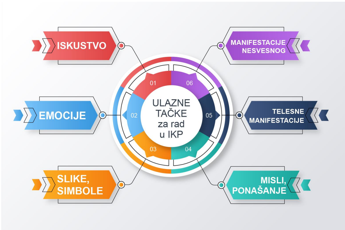
Slika 3. Ulazne tačke u radu u integralnoj kauzalnoj psihoterapiji.